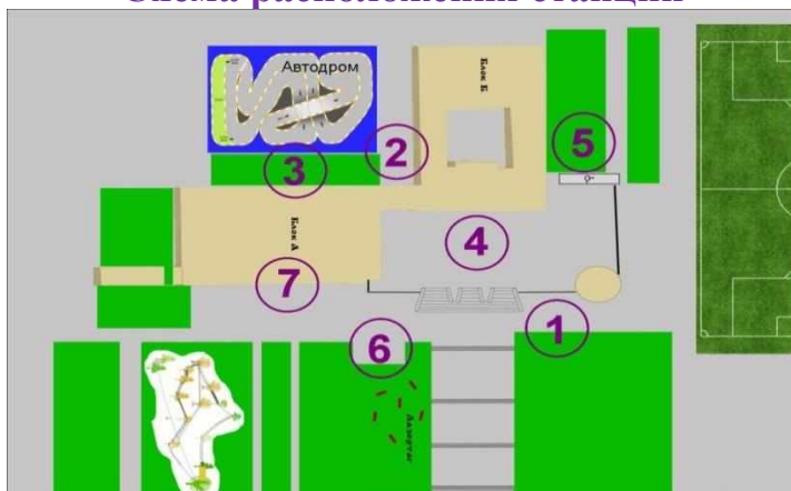
Схема расположения станций